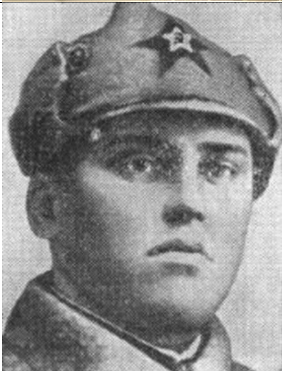
Степан Христофорович Горобец (1913—1942)